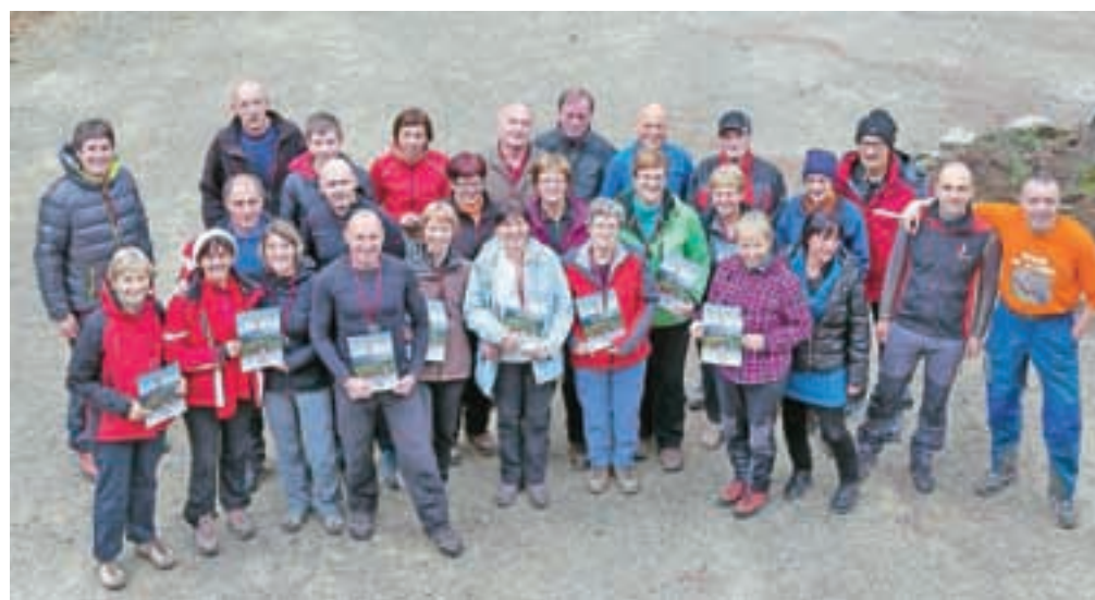
(Vsaj) stokrat so bili letos na Kamneku. Se ve, da je vsak štel zase.

Dom pod Storžičem – Planinsko društvo Tržič je v nedeljo v Domu pod Storžičem pripravilo zaključek akcije 100-krat na Kamnek 2014 s podelitvijo priznanj in prijetnim družabnim in kulinaricno začinjenim druženjem. Kamnek je sicer vrh nad Tržičem na 873 metrih nadmorske višine, nanj pa vodi veliko poti, ena denimo od gradu Neuhaus nad stari mestom. Na vrhu sta klopca za počitek in vpisna knjiga. Pravijo, da to, kar sta Kranjčanom Jošt in Šmarjetna, je Tržičanom Kamnek.