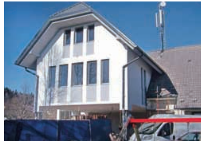
Takole je videti večnamenski objekt od zunaj.