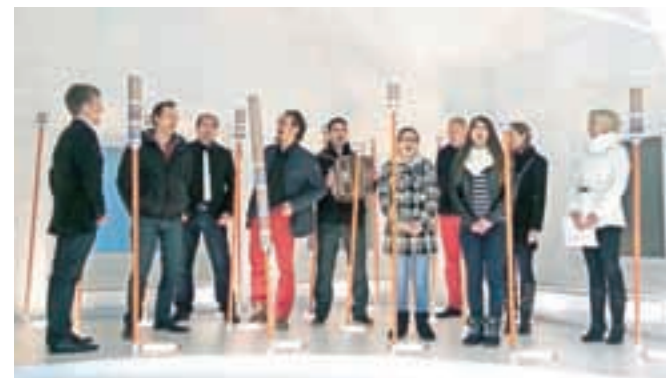
Čudovit koncert KD Jerbas v Tržiškem muzeju

Tržič – V nedeljo, 14. decembra, je Kulturno društvo Jerbas v Tržiškem muzeju pripravilo koncert z naslovom U Tržič s m pršu: s pesmijo po zbirkah muzeja. Pevci in godci skupine Jerbas, v kateri se člani ukvarjajo s poustvarjanjem slovenskega pevskega in instrumentalnega glasbenega izročila, so pripravili sprehod, kjer smo si lahko ogledali zbirke ter ob tem prisluhnili pesemskemu izročilu, ki se kot dediščina lepo dopolnjuje z vsebinami, predstavljenimi v zbirkah.