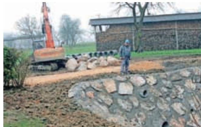
Udor ceste na Hudem so že sanirali, izvajalec del je bilo podjetje VGP Kranj.