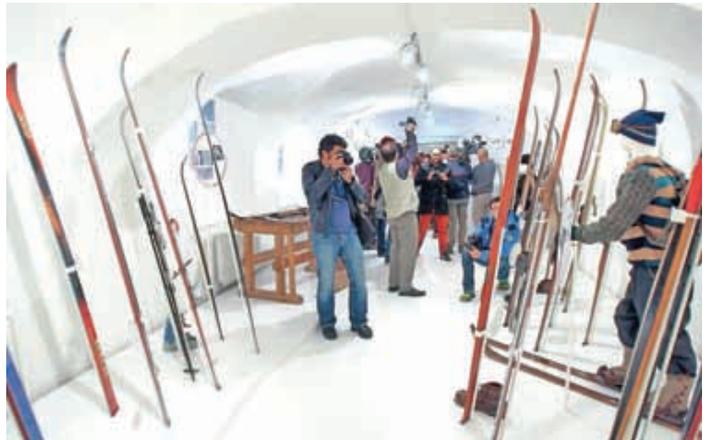
Zbirka v prvem Slovenskem smučarskem muzeju