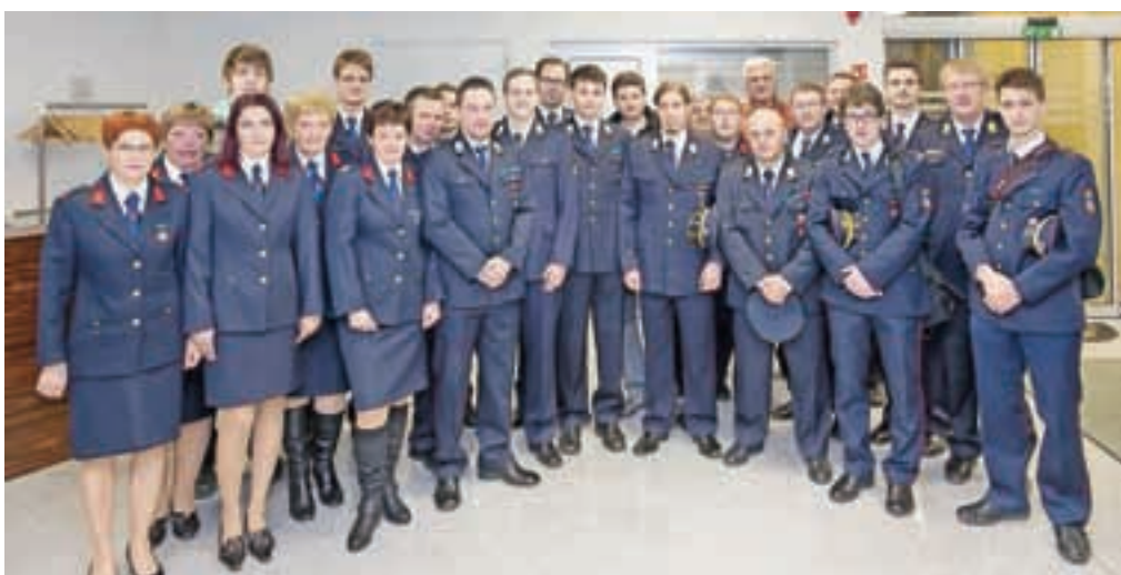
Operativna enota PGD Križe