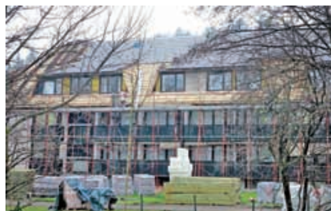
V začetku jeseni so začeli menjati dotrajano streho na Domu Petra Uzarja.

Tržič – Na Domu Petra Uzarja so jeseni začeli z menjavo strešne kritine, z deli naj bi v grobem končali do konca leta, nekateri zaključki, kot so fasaderska dela, pa bodo verjetno počakala na ugodne vremenske razmere. "V celoti streho financiramo z lastnimi sredstvi – zaradi dotrajane strešne kritine ni bilo več mogoče čakati na možnosti novih razpisov, saj je v dom že zamakalo. Ob tem izvajamo tudi energetske sanacije