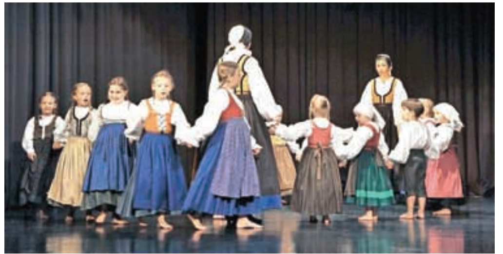
Mlajša otroška FS Karavanke

Tržič – Kulturno društvo Folklorna skupina Karavanke je na novembrsko soboto v Kulturnem centru Tržič pripravilo letni koncert z naslovom Folklornik, to sem jaz. Rdeča nit koncerta je bila tokrat martinovo. Martinovo je praznik, posvečen novemu vinu, ali povedano z drugimi besedami, to je obdobje, težko je reči dan, ko se mošt spremeni v vino. Martinovanje je bilo v preteklosti povezano z veseljem ob koncu letine, koncem sezonskega dela in pastirskim praznovanjem, folklorniki Folklorne skupine Karavanke pa smo strnili svoj program, ki smo ga oblikovali v letošnjem letu, in svojo »letino« predstavili na omenjenem koncertu. Letošnje leto je bilo za društvo zelo uspešno, saj so kar tri od štirih folklornih skupin dosegle državni nivo poustvarjanja slovenskega ljudskega izročila, kar si prav zagotovo zasluži praznovanje ob koncu leta. Pred leti so na nekaterih kmetijah, kjer so pridelovali vino, prirejali ob koncu leta t. i. pušl šank. Prišli so ljudje od blizu in daleč, da so se po naporu malo razvedrili. Na pušl šanku so zapeli