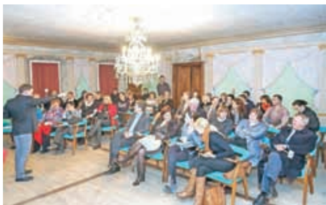
Torkov decembrski večer v Pollakovi sobi Tržiškega muzeja je bil ovit v dobrodelnost.