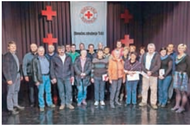
Krvodajalci občine Tržič rešujejo življenja.