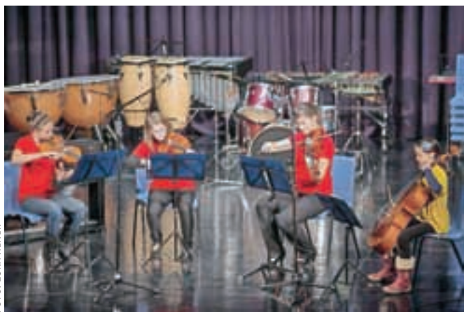
Mlade glasbenice in glasbeniki so ponovno blesteli.