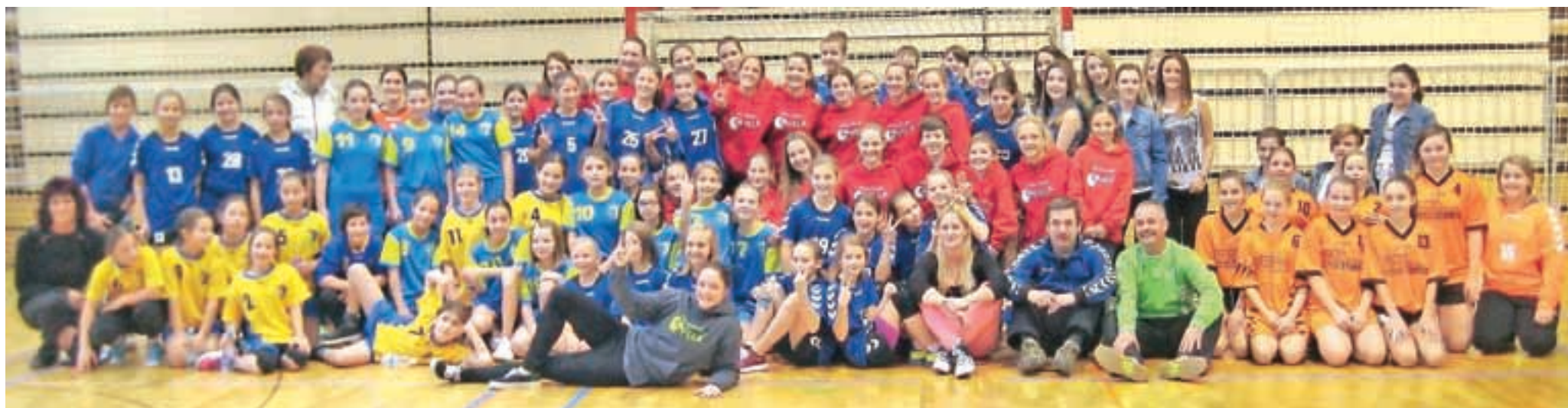
Spomn vseh sodelujočih na božično-novoletni turnir

V Dvorani tržiških olimpijcev je potekal tradicionalni božično-novoletni rokometni turnir.